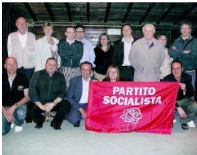
I GRUPPI A sinistra, Comunisti per Pontedera. Sopra, il Partito Socialista