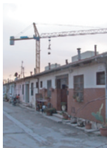
VIA CORSICA Va avanti lo sgombero delle case minime