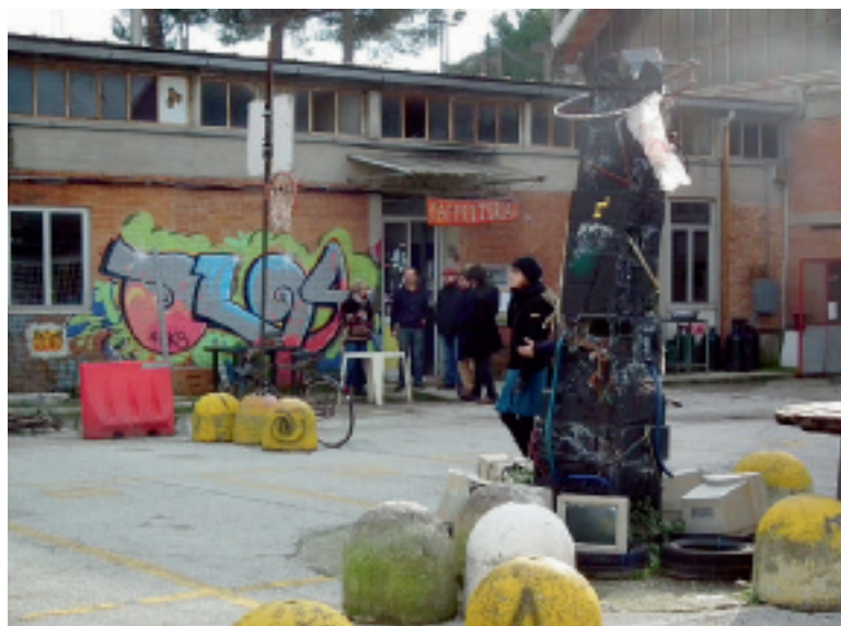
LA VERTENZA Decine di giovani pronti a difendere la sede