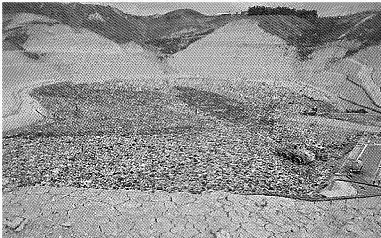
IMPIANTO La discarica di Legoli è gestita dalla Belvedere spa, società partecipata ad azionariato diffuso: ha anche il certificato Emas